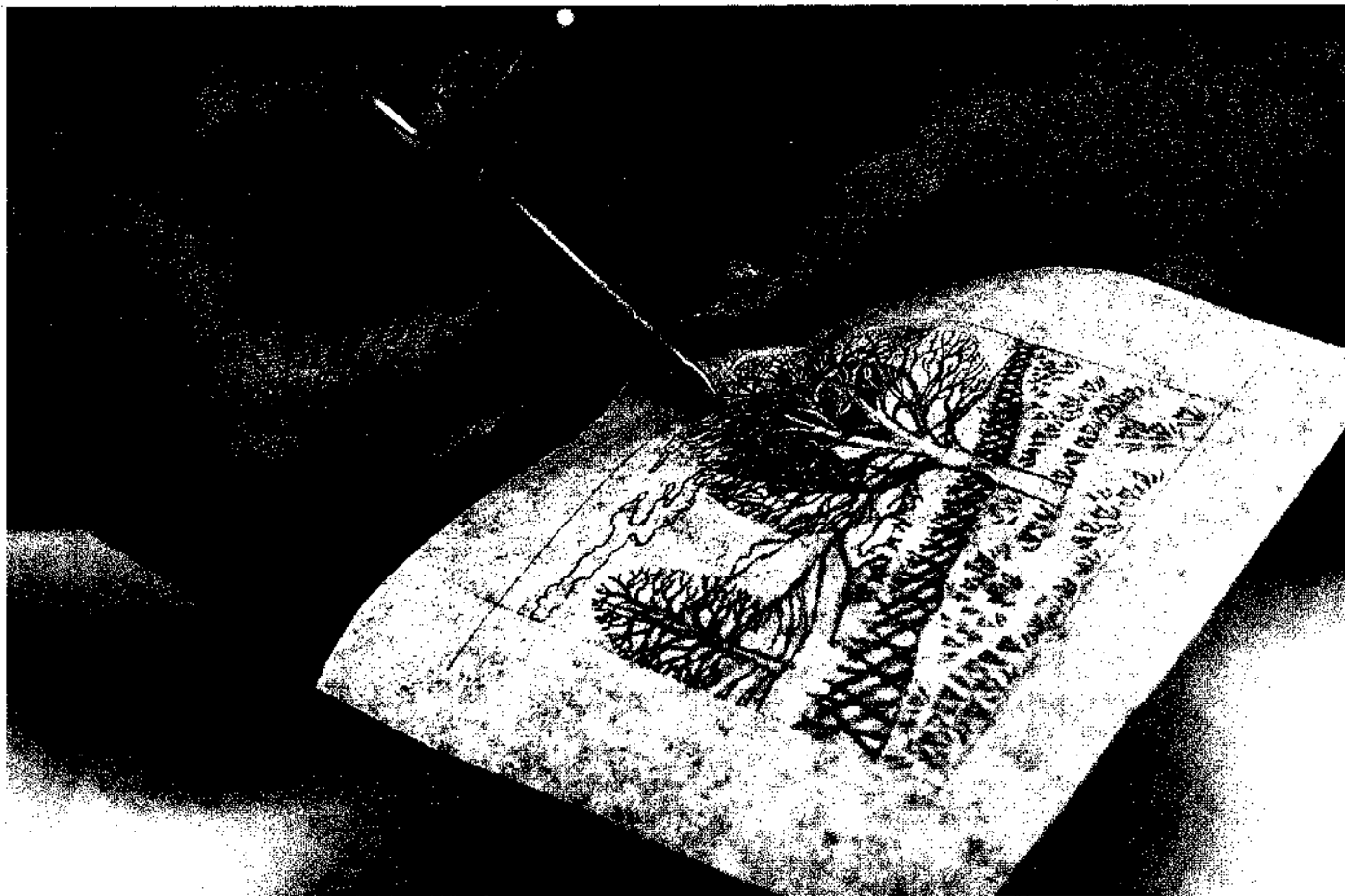
Die spitzige Schere ist mit ruhiger Hand zu führen.