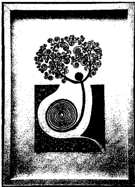
In filigraner Feinarbeit schneidet Imelda Grisch zusätzlich zum Haupt-sujet Spiralen aus dem schwarzen Scherenschnitt-papier und ziert so ihre «Menschenbäume».

ihrem Innern: «Die Ideen kommen oft von Kleinigkeiten, die ich irgendwo gesehen habe», sagt sie dazu. Ein Beispiel dafür sind die traditionellen Prättigauer Hauszeichen, die sie im Bild selbst verwendet oder die sie als Rand schneidet.